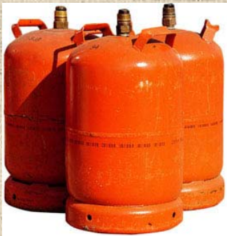
Ampolles de gas 11Kg

Si ja tenen una ampolla espanyola, se'ls hi farà el canvi d'ampolla sense cap problema.