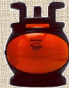
Ampolla de gas 6Kg

A Recepció els informarem acuradament de les diferents opcions existents i així poder escollir a la que s'amotlli millor a vostè.